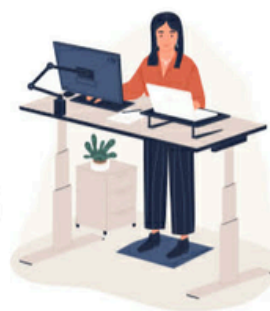
Ett höj- och sänkbart skrivbord är bra vid datorarbete.

Två enkla övningar (se nästa sida) räcker för att stärka musklerna. Övningarna kan göras när och var som helst. Dagliga övningar återställer