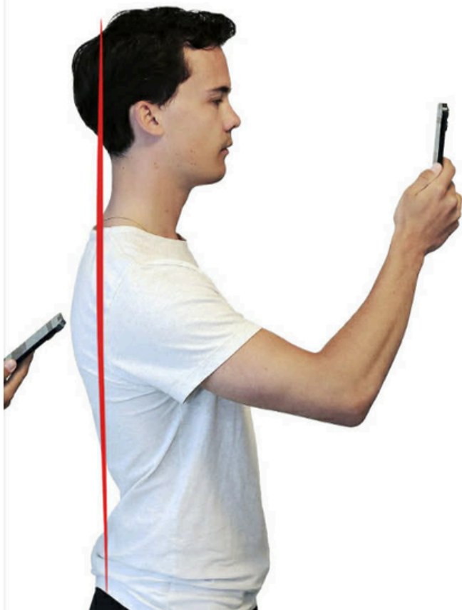
nackens kotor och diskar.